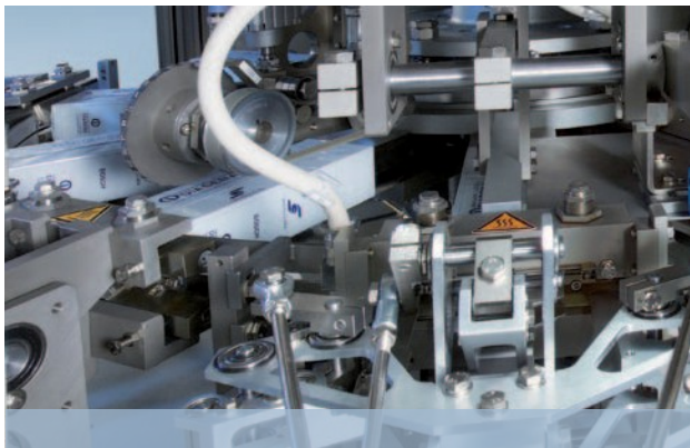
Modelagem precisa do pacote por meio de uma roda de mandril