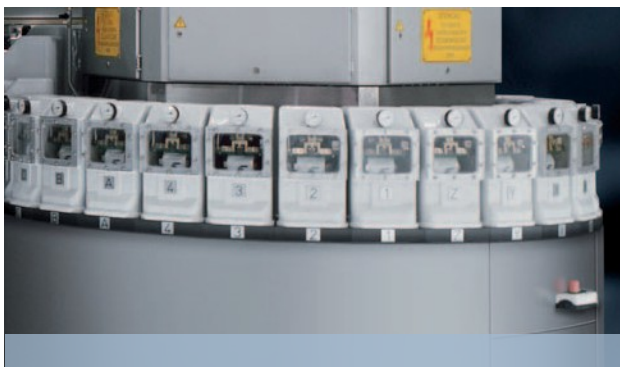
Alto vácuo da bolsa devido à roda de vácuo com 28 câmaras