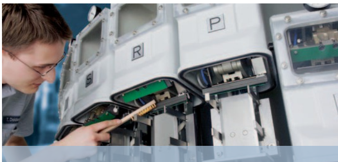
Peças de fácil acesso aceleram a limpeza e a manutenção