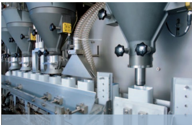
Sistema de enchimento calibrado de alto desempenho